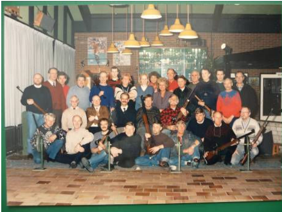
Schietvereniging De Vrijheid 1994